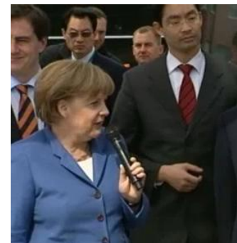
Bundeswirtschaftsminister und Vizekanzler Dr. Philipp Rösler bei der Eröffnung der Cebit 2012