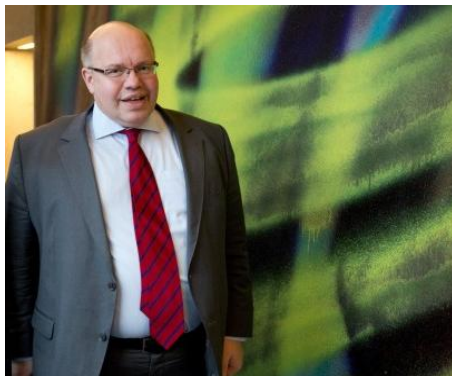
Bundesumweltminister Peter Altmaier