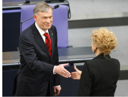
Bundespräsident a.D. Horst Köhler bei seiner Wiederwahl am 25. Mai 2009