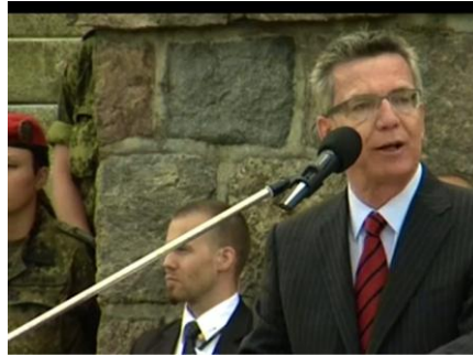
Bundesminister der Verteidigung und Bundesminister des Innern a.D. Thomas de Maizière