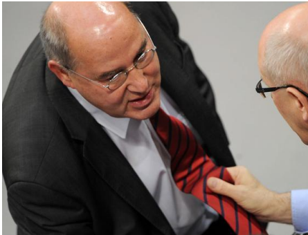
Dr. Gregor Gysi, Fraktionsvorsitzender von DIE LINKE, Dezember 2011