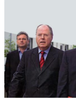
Bundesfinanzminister a.D. Peer Steinbrück, MdB, in Focus, Nr. 31/11, August 2011