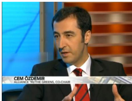
Bundesvorsitzender des Bündnis 90 / Die Grünen Cem Özdemir, MdB, auf Bloomberg TV, New York, Mai 2011