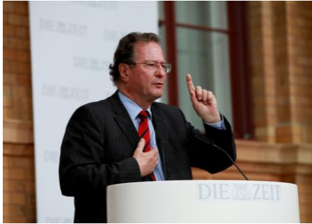
Bundesjustizminister a. D. und Bundesminister des Auswärtigen a. D. Klaus Kinkel