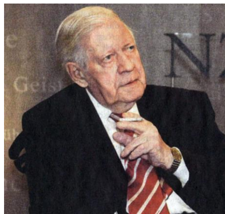
Bundeskanzler a.D. Helmut Schmidt