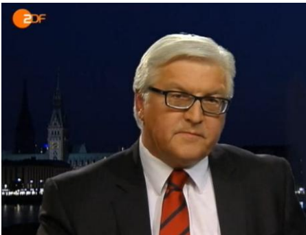
Fraktionsvorsitzender der SPD und Vizekanzler a.D. Dr. Frank-Walter Steinmeier, Mai 2011