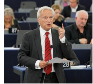
Vorsitzender der Fraktion der Sozialdemokratischen Partei Europas, Hannes Swoboda